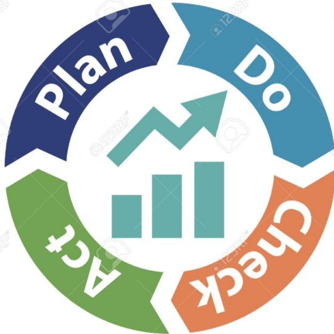
Process Improvement PDCA Methodology